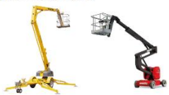
Catégorie B : PEMP du groupe B, de type 1 ou 3

Extrait Recommandation adoptée par plusieurs CTN en octobre 2019